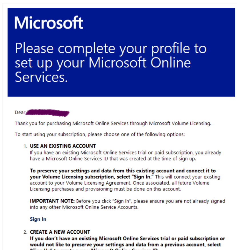
Slika 2: Primer e-poštnega sporočila s povezavo za prevzem licenc